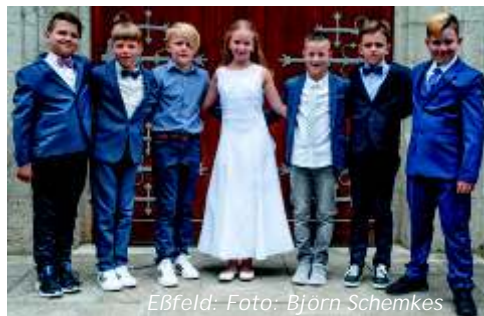
Eßfeld: Foto: Björn Schemkes

Termine Kommunion 2022: 24. April 2022 in Giebelstadt; 14. Mai 2022 in Sulzdorf; 22. Mai in Bütthard; 26. Mai in Eßfeld